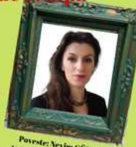
Poveste: Nevim GÜREL Vakıfbank Atatürk Școală gimnazială Havza / SAMSUN